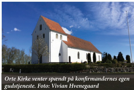
Orte Kirke venter spændt på konfirmandernes egen gudstjeneste.

Torsdag d. 26. marts kl. 19.00 i Orte Kirke